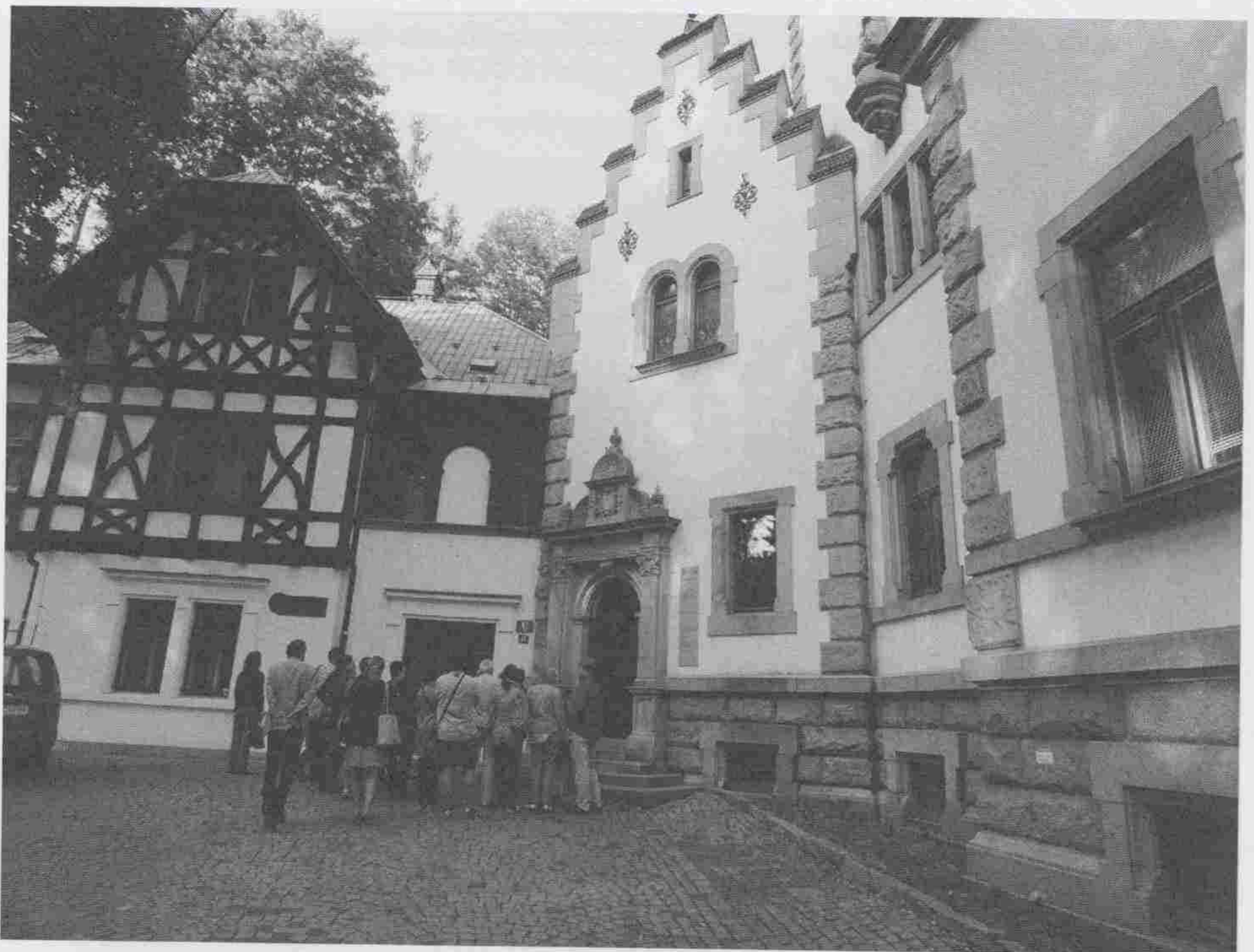
Účastníci 24. ročníku libereckého semináře při návštěvě Liebiegovy vily; 21. 8. 2014.